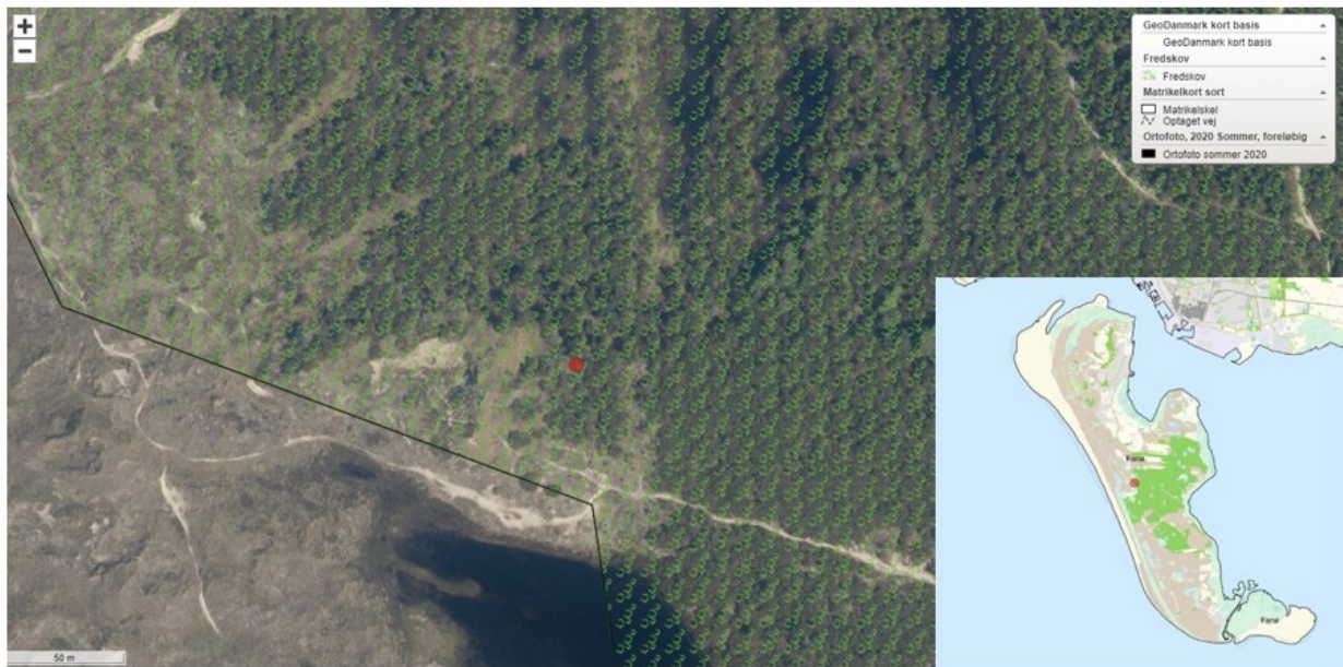
Figur 1: Rød cirkel på kortet viser omtrentlig placering af skulptur.

Miljøstyrelsen giver hermed dispensation efter skovloven til opsætning af en skulptur (Land Art) på matr. nr. 292a Rindby By, Nordby, som ligger i Fanø Kommune. Projektet vedrører ca. 100 m 2 fredskovspligtigt areal. Projektets placering og omfang fremgår af nedenstående kort (figur 1).