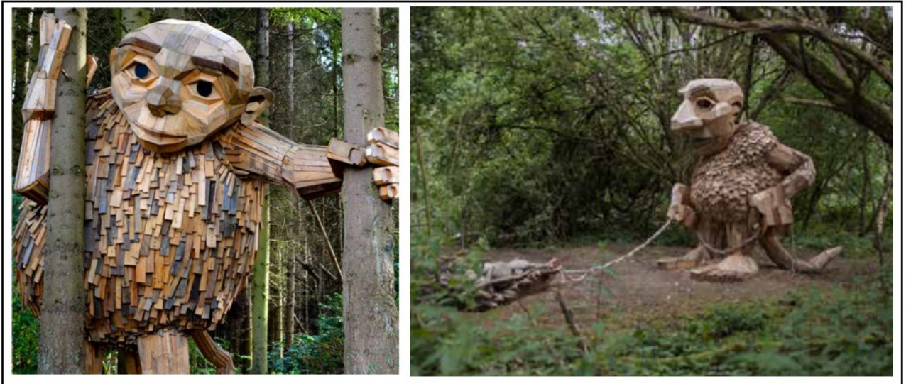
Figur 3: Eksempler på lignende skulpturer af Thomas Dambo. Billederne er fremsendt af ansøger.

Den 8. august 2020 har Naturstyrelsen Blåvandshuk givet tilladelse til opsætning af skulpturen på matr. nr. 292a Rindby By, Nordby med følgende vilkår: