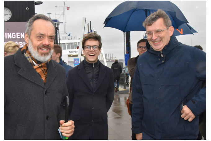
Venstres partiformand Troels Lund Poulsen (th.) var trods vejret i godt humør, da han gæstede Fanø 1. november.