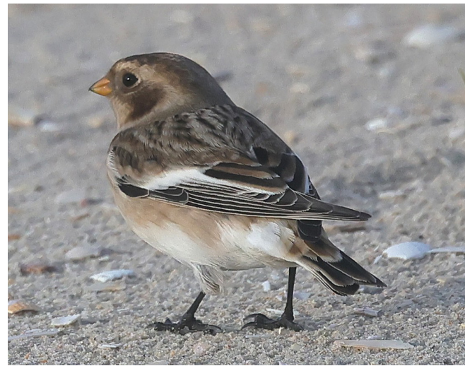
Snespurven kendes på sin sort-brun-hvide fjerdragt.

Snespurven er en arktisk og højarktisk ynglefugl, der ankommer til Fanø fra midt i oktober til først i november. Dens habitatsvalg hænger sammen med fødevalget, og er kystnære strandenge med opskylzoner, hvori den finder frø fra planter, da den som alle andre værlinger er 100 procent frøædere. På Fanø kan du se snespurven i klitlandskabet og strandengen