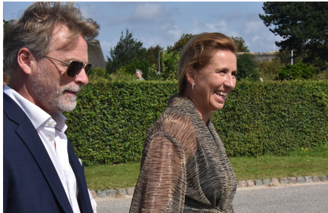
Ministerbilen var der, fordi statsminister Mette Frederiksen deltog sammen med sin mand, filmanden Bo Tengberg.