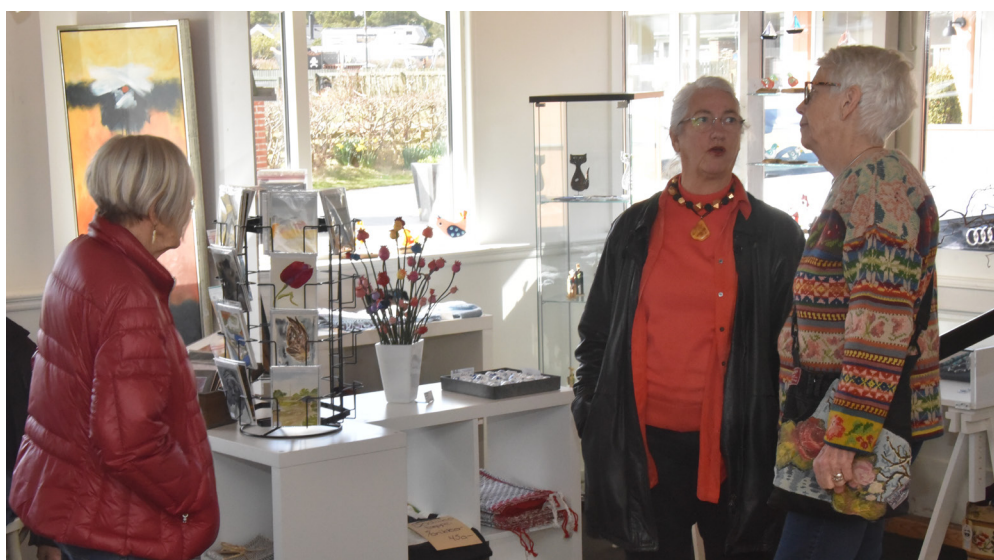
Ferniseringerne hos Fanø Strandgalleri er altid hyggelige og velbesøgte.