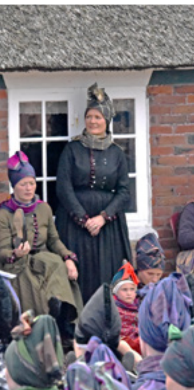
Foran sidder de små brudepiger.