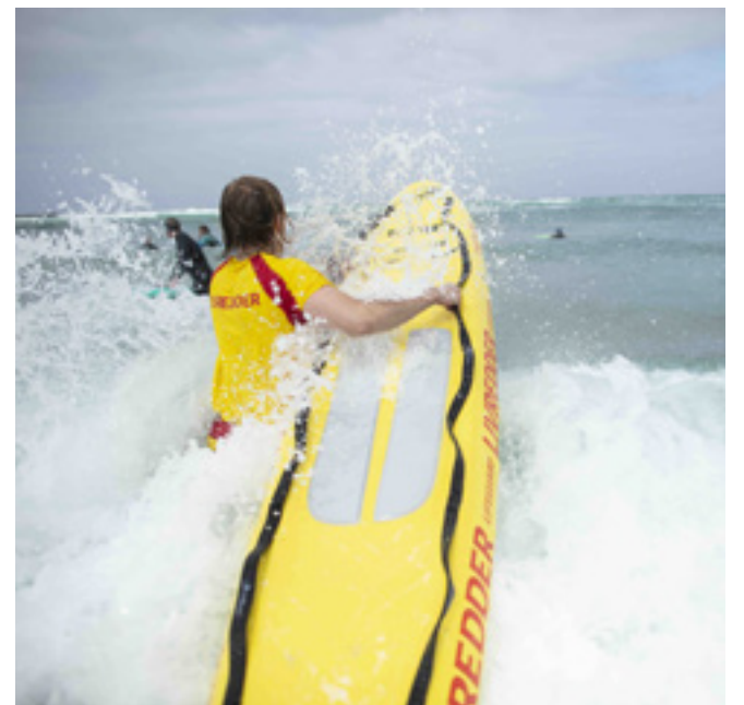
Når der ikke er folk på stranden, træner de unge livreddere og studerer de lokale forhold.

Livredderne opfordrer familier til at komme forbi tårnet og få inspiration til sjove lege i vandet, som samtidig vil styrke børnenes svømme- og vandfærdigheder.