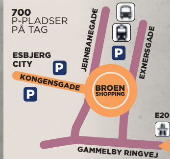
HUSK P-SKIVEN PARKSCHEIBE EINSTELLEN SET THE PARKING DISC