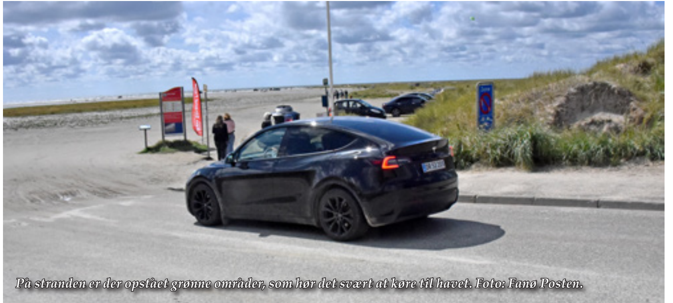
På stranden er der opstået grønne områder, som gør det svært at køre til havet.