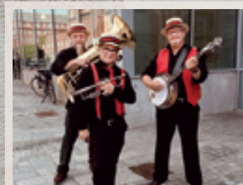
SOMMERJAZZ FRØSIGS STREET PARADERS LØRDAG DEN 27. JULI FRA KL. 11-14