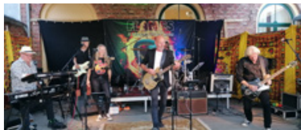
Flames fra Guldager satte fut i dansegulvet i 2023.