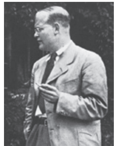
Dietrich Bonhoeffer.