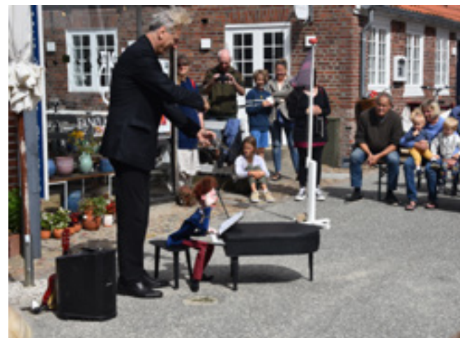
Fra en af forestillingerne i 2022. Gadeteaterfestivalen plejer at tiltrække mange børnefamilier.

Fra torsdag den 8. til og med lørdag den 10. august er der atter gadeteaterfestival i Nordbys gader og ved skolen