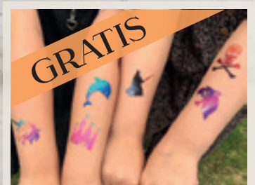
GRATIS GLITTER TATTOO LØRDAG DEN 27. JULI FRA KL. 11-15