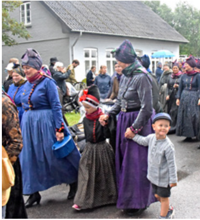
Her er søndagsoptøget fra kirken på vej gennem byen.

”Frier er vigtige fordi vi alle trænger til at slappe af, men også fordi det at være så tæt sammen giver os den nærhed vi kan mangle i hverdagen. Vi som familier vil rigtig mange ting, og vi vil helst ikke gå glip af noget, hvilket hurtigt kan stille os i et dilemma, for skal vi slappe af eller kigge på domkirker? Men måske kan begge dele lade sig gøre,” siger hun.