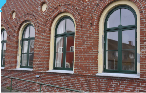
Et af disse vinduer har Spar doneret penge til.