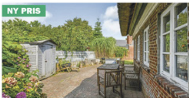
Nordby - Vangled 2A

Kontantpris: 4.250.000 Ejerudgift pr. md: 2.948 Udbetaling: 215.000 Brt/nt excl. ejerudg: 25.998/20.826 Sag: 30684