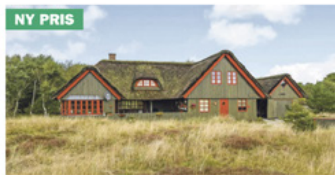
Rindby Strand - Nybyvej 11

Kontantpris: 1.345.000 Ejerudgift pr. md: 2.505 Udbetaling: 70.000 Brt/nt excl. ejerudg: 8.190/6.572 Sag: 90192