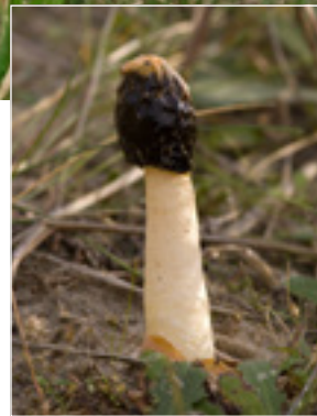
Sand-stinksvamp fra Fanø Klitter.

stemmelsen. Benyt gerne en eller flere svampebøger af nyere dato. FanøNatur ser frem til af få fotos fra dig.