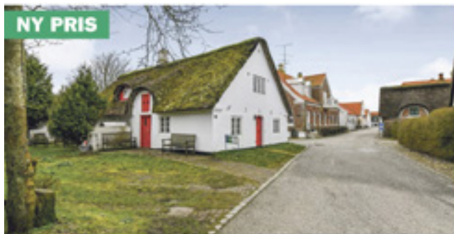
Sønderho - Sønder Land 9

God dynamik på møde om Fanøs fremtid Læs side 12-13