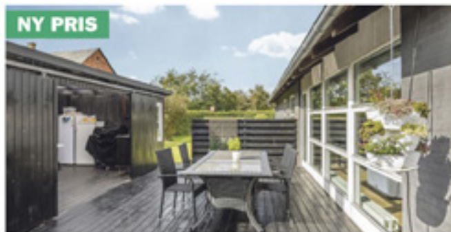
Nordby - Vestervejen 8

Kontantpris: 2.395.000 Ejerudgift pr. md: 2.665 Udbetaling: 120.000 Brt/nt excl. ejerudg: 14.548/11.674 Villa, 1 fam. Sag: 90433