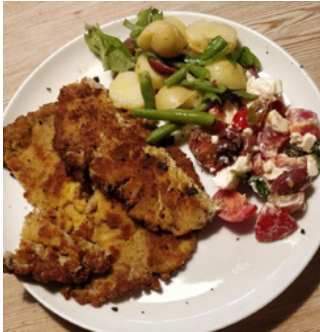
Middagsret med stor kæmpe-parasolhat, kartoffelsalat og tomatsalat.

FANØ – På redaktionen modtager vi et hav af spøjse statistikhistorier. Derfor kan vi i dette nummer berette, at vi har bundrekord i antal skilsmisser per 1000 gifte indbyggere, og at vi har de ældste førstegangsfødende udenfor hovedstadsområdet! Man skal dog lige huske, at små tal giver usikre statistikker. Hvad skilsmisserne angår, så var der kun 2 om året i 2022 i Fanø Kommune, altså 2 promille. En anden ø, Ærø, ligger også lavt med 2,2. Selvom Læsø ligger over landsgennemsnittet, så tolker afsenderen af historien, et begravelsesrådgivningsfirma ved navn Lavendla, det som et ø-fænomen. Højest ligger Faxe med 8 skilsmisser i 2022. Guldborgsund og København ligger også højt. Med hensyn til førstegangsfødende, så lå gennemsnitsalderen for førstegangsfødende i Fanø Kommune i 2022 på 31,2 år mod 28,5 i 2007. Kun i København og et par andre hovedstadskommuner er det en smule højere nu. Gennemsnitsalderen er steget i alle kommuner side, 1986. I Fanø Kommune var stigningen 4,8 år.