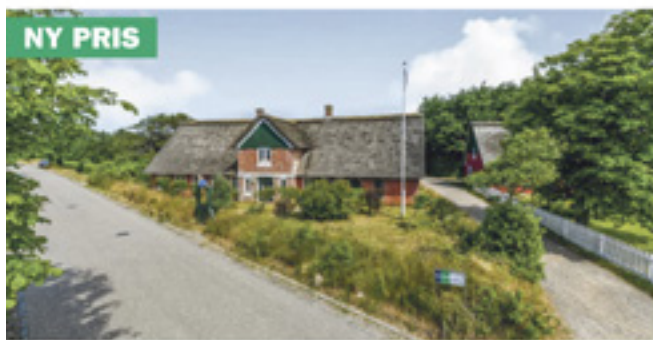
Sønderho - GALIONSGÅRDEN, Landevejen 27

Kontantpris: 2.598.000 Ejerudgift pr. md: 2.588 Udbetaling: 130.000 Brt/nt excl. ejerudg: 15.975/12.796 Fritidshus Sag: 21153