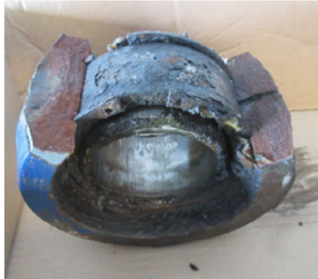
Det knuste ledøje.

Dog stiller konsulent fra Sedgwick spørgsmåls-