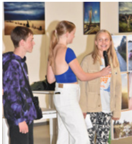
Fanøs unge var meget aktive i debatten.