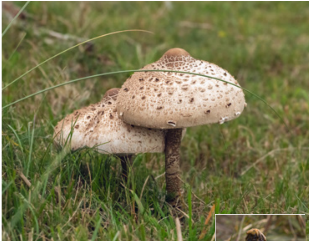
Stor kæmpe-parasolhat halvt åben.

Helt anderledes er det med frugtlegemet hos stor kæmpe-parasolhat. Det er velsmagende og meget stort helt op til 30 centimeter i diameter. Selve svampen er 15 til 30 centimeter høj, så det er en svamp, man kan få øje på i klitterne. Den gror i den grå klit. Et par af dens kendetegn er et brunt slangeskinsmønster på stokken og den store løstsiddende dobbeltring om stokken. På hatten er der mange brune skæl, så folk kalder den også slangesvamp eller -hat. Den opfører sig præcist som din parasol i haven. Først er den lukket og ligner en trommestik fra