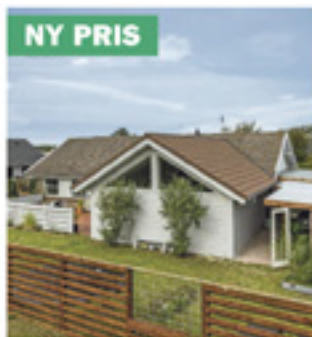
Nordby - Vestervangen 2

Kontantpris: 1.798.000 Ejerudgift pr. md: 2.742 Udbetaling: 90.000 Brt/nt excl. ejerudg: 10.943/8.781 Sag: 90451