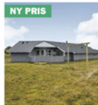
Fanø Bad - Norges Fjelde 18

Kontantpris: 1.995.000 Ejerudgift pr. md: 2.887 Udbetaling: 100.000 Brt/nt excl. ejerudg: 12.131/9.735 Sag: 90209