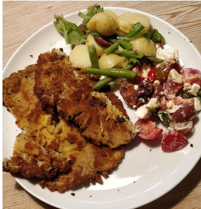
Middagsret med stor kæmpe-parasolhat, kartoffelsalat og tomatsalat.

FANØ – På redaktionen modtager vi et hav af spøjse statistikhistorier. Derfor kan vi i dette nummer berette, at vi har bundrekord i antal skilsmisser per 1000 gifte indbyggere, og at vi har de ældste førstegangsfødende udenfor hovedstadsområdet! Man skal dog lige huske, at små tal giver usikre statistikker. Hvad skilsmisserne angår, så var der kun 2 om året i 2022 i Fanø Kommune, altså 2 promille. En anden ø, Ærø, ligger også lavt med 2,2. Selvom Læsø ligger over landsgennemsnittet, så tolker afsenderen af historien, et begravelsesrådgivningsfirma ved navn Lavendla, det som et ø-fænomen. Højest ligger Faxe med 8 skilsmisser i 2022. Guldborgsund og København ligger også højt. Med hensyn til førstegangsfødende, så lå gennemsnitsalderen for førstegangsfødende i Fanø Kommune i 2022 på 31,2 år mod 28,5 i 2007. Kun i København og et par andre hovedstadskommuner er det en smule højere nu. Gennemsnitsalderen er steget i alle kommuner side, 1986. I Fanø Kommune var stigningen 4,8 år.