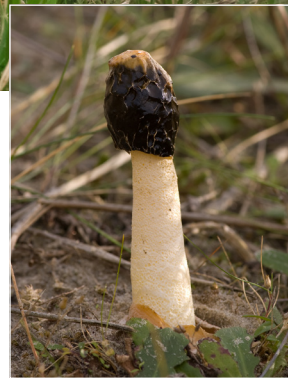
Sand-stinksvamp fra Fanø Klitter.

Tilmeld dig nu, og oplev den bedste TV-underholdning på Fanø