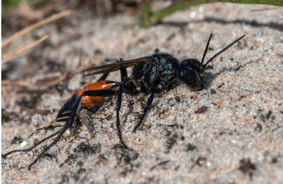
Almindelig sandhveps. Er den grum, nyttig eller højrudviklet?

Sandhvepsen hører til grahvvepsene, så yngleaktiviteterne begynder med, at der graves et 10-20 centimeter dybt hul i sandet. Her skal ægget lægges, den kommende larve leve og puppen udvikles. For insekter er larvelivet vigtigt. Der skal være nok at spise ellers bliver det voksne insekt ikke ordentlig udviklet – redegullet skal altså fyldes med mad. Derfor går sandhvepsen på jagt. Den fanger sommerfuglelarver, stikker og bider dem i centralnervesystemet, så de lammes. Fotoet viser, hvordan larven slæbes dem ned i redegullet. Når hullet er fyldt, lægges ægget. Den kommende hvepselave har nu lammet, men levende