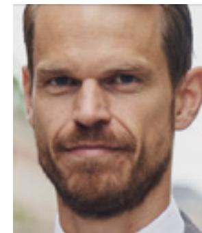
Professor Svend Brinkmann.

NORDBY – Torsdag den 9. november klokken 19 kommer Svend Brinkmann til Fanø, nærmere betegnet Nordby Kirke, og holder sit foredrag Tænk. Han er som vanligt klar med nye, underholdende observationer og betragtninger, og denne gang i et forsvar for det tankefulde liv i en tankefuld tid. Vi skal tænke bedre, ikke mindre - det er