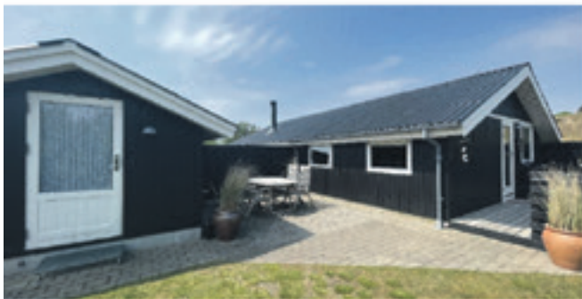
Rindby Strand - Gegevej 21B