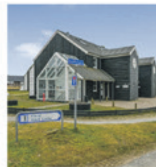
Fanø Bad - Golfvejen 2A, 1.