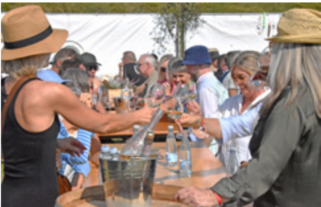
Fanø Vesterland: Stråhatte, muntre kvinder og vin.