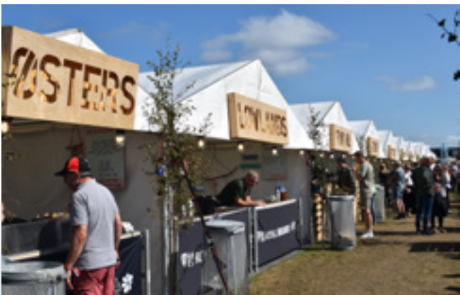
Restaurantgaden, før 'helvede' brød løs.

Fanø Vesterland havde igen fået en god aftale med vejrguderne, så på to solbeskinnede septemberdage kom den bedste festival nogensinde i hus