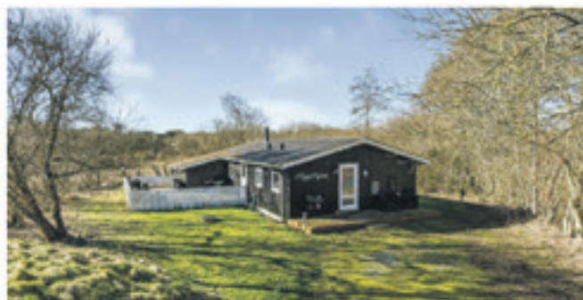
Rindby Strand - Nygårdstoft 9