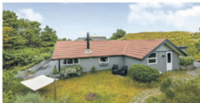
Rindby Strand - Nybyvej 44