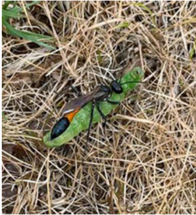
Sandhvepsen har fanget og lammet en larve.