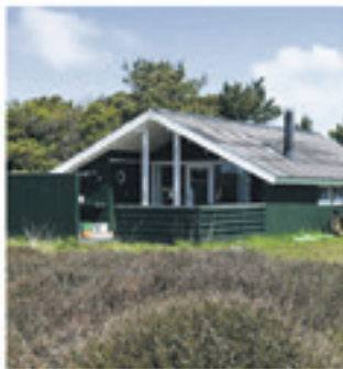
Senderho - Vester Storetoft