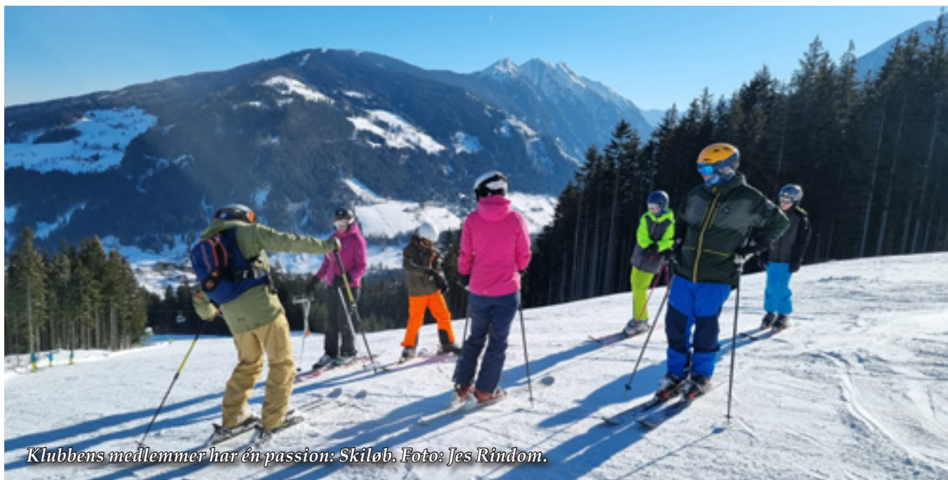
Klubbens medlemmer har én passion: Skiløb.