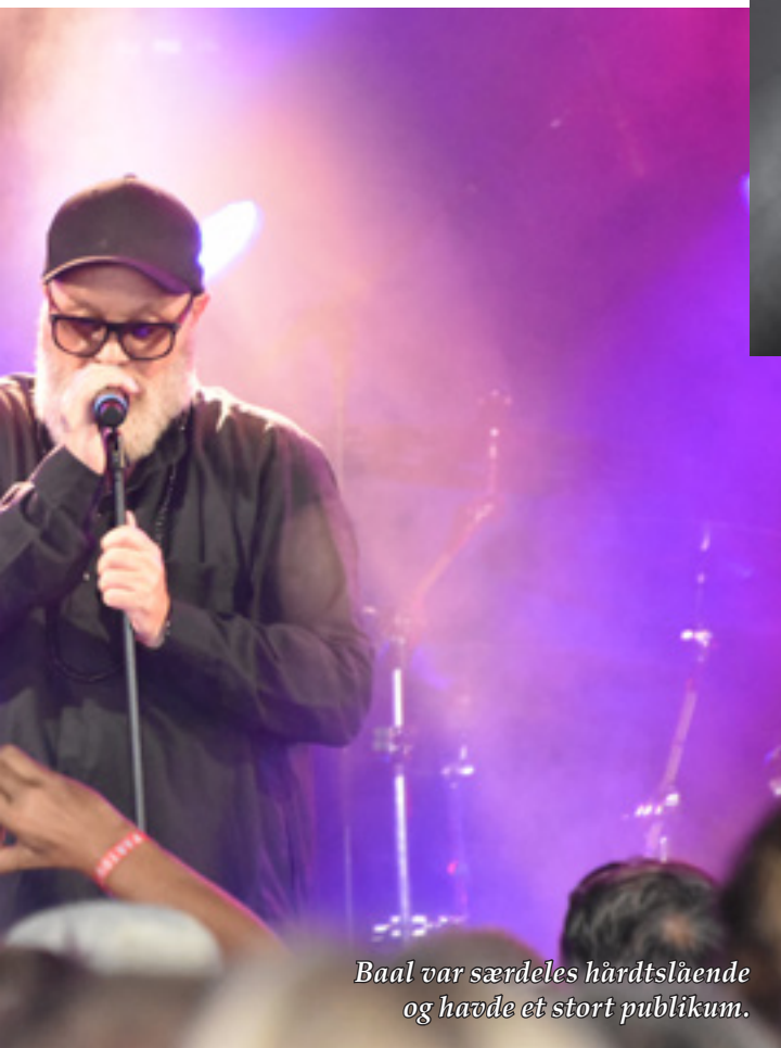
Baal var særdeles hårdtslående og havde et stort publikum.