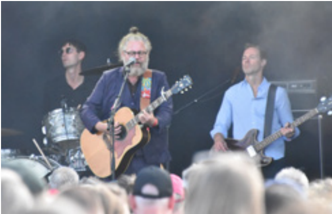
Søren Huss var beåndet af Povl Dissing denne dag.