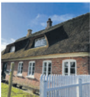
Nordby - Lindevej 14