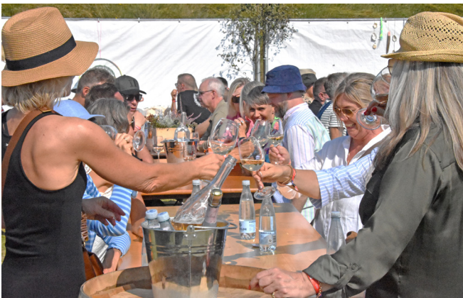
Fanø Vesterland: Stråhatte, muntre kvinder og vin.