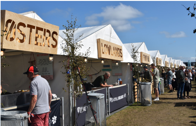
Restaurantgaden, før 'helvede' brød løs.