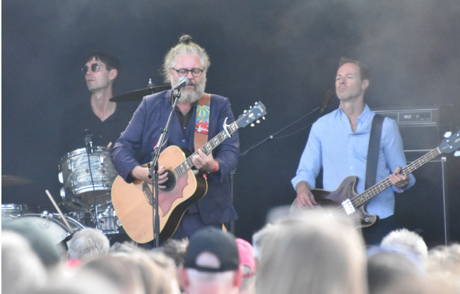
Søren Huss var beåndet af Povl Dissing denne dag.