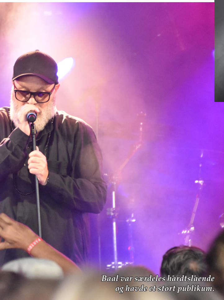
Baal var særdeles hårdtslående og havde et stort publikum.