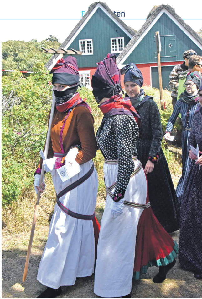
Datidens arbejdstøj. Struden beskyttede mod sand og sol.