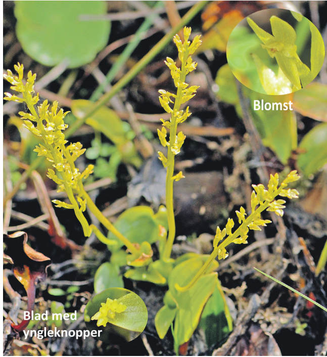
Hjertelæbe med blomst og ynglekopper.