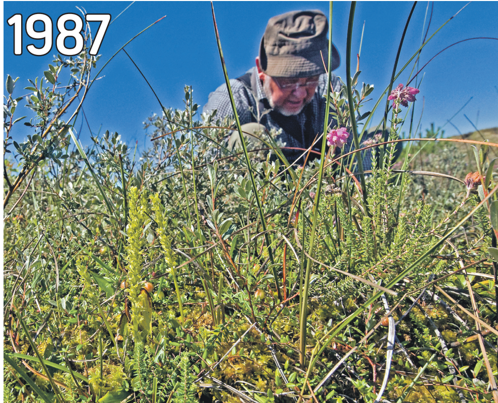
Fund af de mange orkideer betød mange gæster på Fanø. I år er der næsten ingen tilbage.

Hjertelæbe er en lille orkidé, så den skygges hurtigt væk af højere planter