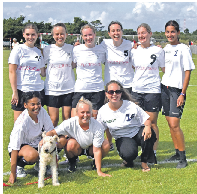
Dette hold, Sygeplejerskerne, havde deres egen maskot med. Den tog det hele meget roligt.

"Og sikke en fodbold fest! Det var med stor glæde og