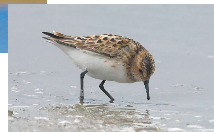
En dværgryle fouragerer i vandkanten.

Så for hver dag, lige nu, stiger antallet af arter og individer af vadefugle på Fanø og i Nationalpark Vadehavet generelt. For en måned siden var her kun de ynglende vadefugle, men for to uger siden begyndte