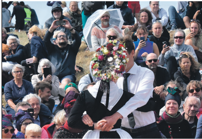
En nygift brud skal have øjne i nakken. Derfor er der spejl i brudekronen, som det ses.

i 2005, hvor hele 65 procent af øens befolkning – typisk nok imod deres egen borgmester og byråds an-