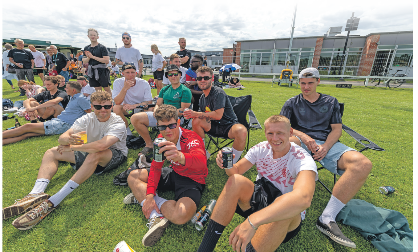
På banerne gjaldt det ikke om at vinde, men om at være med og have det sjovt.