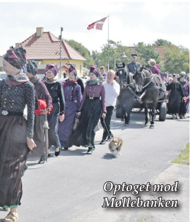
Optøget mod Møllebanken

befaling – stemte imod at indlemme Fanø i Esbjerg Kommune og for at bevare Fanø Kommune som selv-