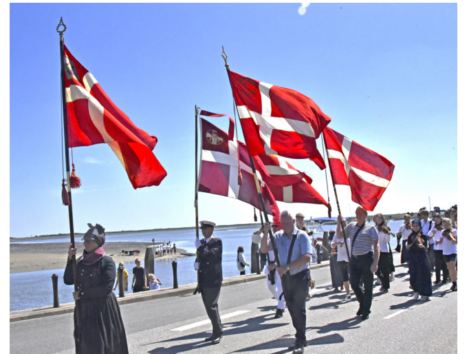
Turen ad Langelinie gav heldigvis deltagerne et pust i ansigtet.