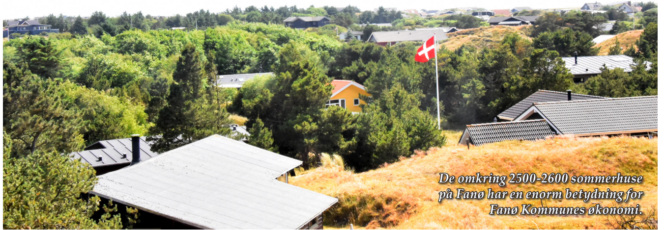
De omkring 2500-2600 sommerhuse på Fanø har en enorm betydning for Fanø Kommunes økonomi.