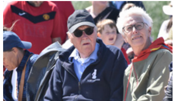
Indvielsen var begunstiget af solrigt vejr.