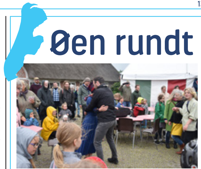
Fra pinsefestivalen i 2019.