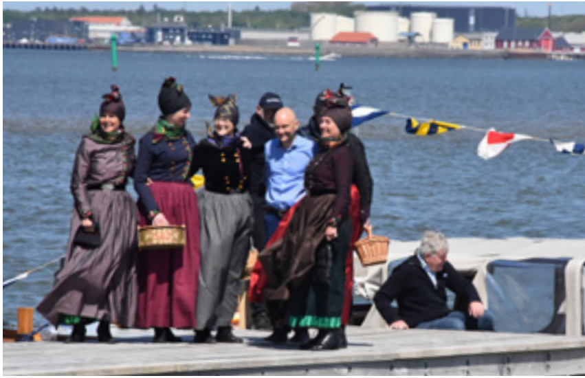
Borgmesteren havde fire Fanø-kvinder med sig.