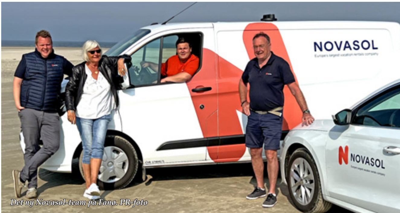
Det nye Novasol-team på Fanø.