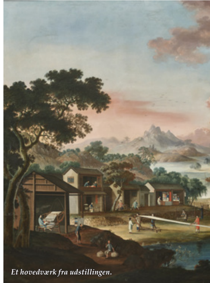
Et hovedværk fra udstillingen.

Udstillingen Kina til Fanø – kinesiske skatte fra