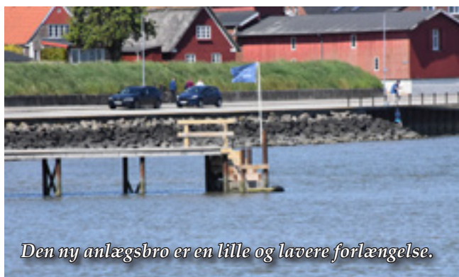
Den ny anlægsbro er en lille og lavere forlængelse.