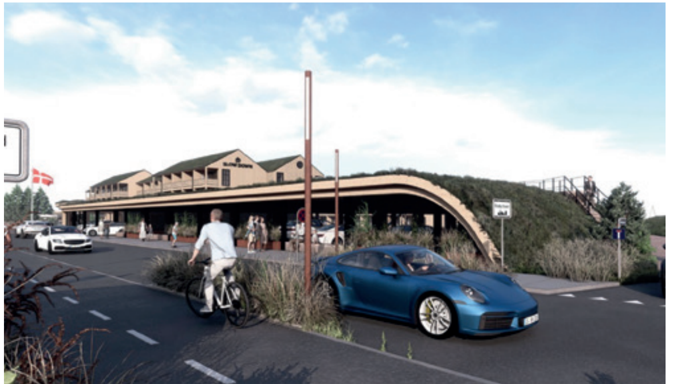
En del af det ny hotelbyggeri ved Rindby Strand. Til højre under den grønne bakke forestiller arkitekterne sig underjordisk parkering.