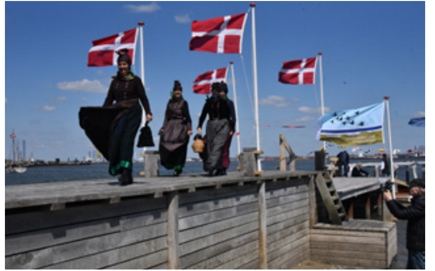
Kvinderne i Fanø-dragter fik sus i skørterne.