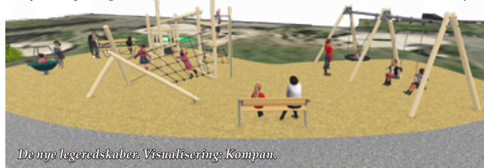
De nye legeredskaber. Visualisering: Kompan.