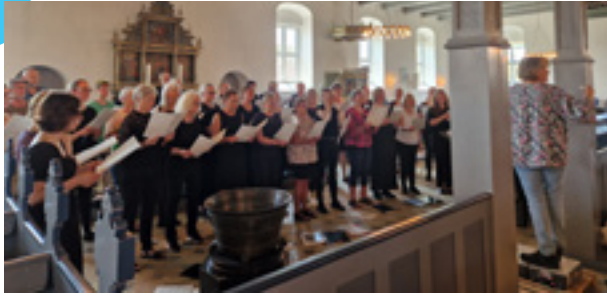
Esbjerg Koncertkor varmer op.