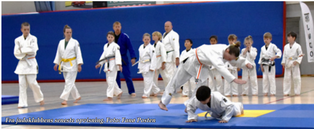
Fra judoklubbens seneste opvisning.