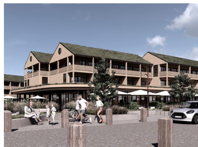
Parti fra promenaden på vej ned til Rindby Strand.

Man kan finde hele planen med alle tegninger her: fanoe.dk/fanoe-kommune/planerne-og-projekterne-for-rindby-strand-og-ankomsten-til-fanoe-hvad-er-op-og-ned