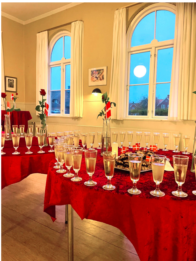
Klar til bobler og kransekage i pausen.