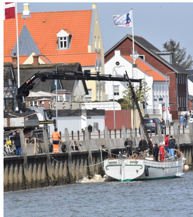
Her hejses stormasten på plads, set fra 'Svenskeren'.