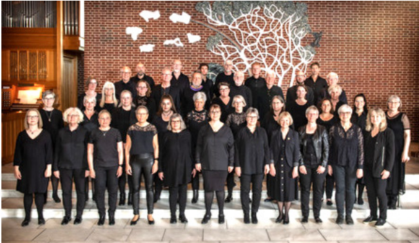
Esbjerg Koncertkor.