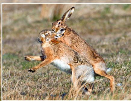
To harer i leg. De ses bedst i timerne efter daggry eller i den sene skumring.