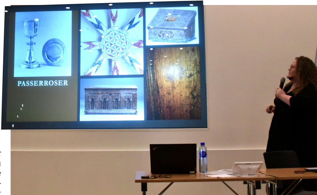
Tegn på gamle huse kan være der for at skræmme onde ånder eller selveste Satan væk.