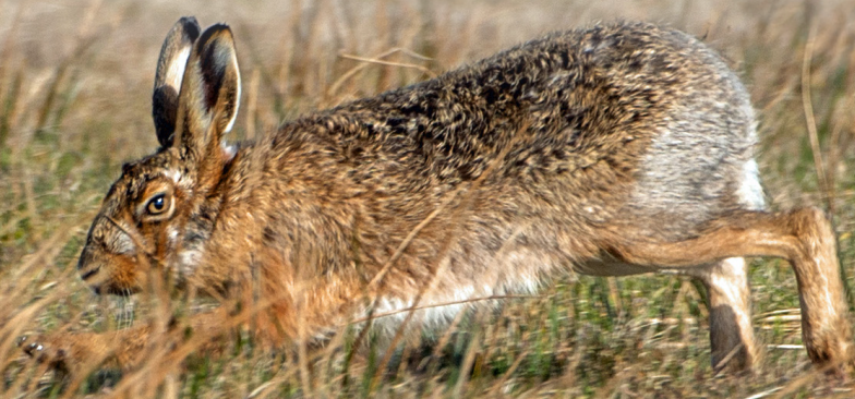
Hare på engen ved Klungebjergvej. Husk kikkert, hvis du vil ud at se efter harer.