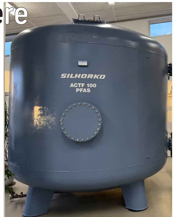
Silhorkos løsning bygger på filterrensning og fjerner PFAS totalt, men der opsamles rester, som skal til forbrænding.

Stofferne er kemisk ekstremt stabile, og der-