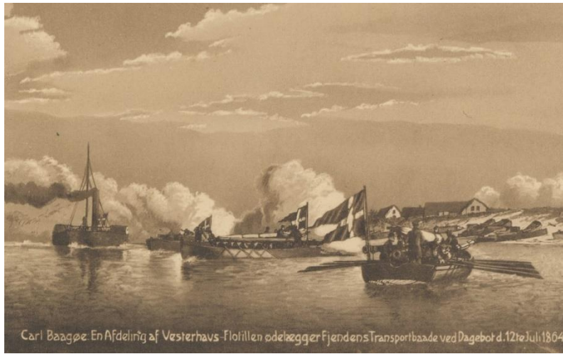
Carl Bogøe. En Afdeling af Vesterhavs-Flotillen ødelægger Fjendens Transportbåde ved Dagebøl d. 12te Jul. 1864.

Samtidigt kobberstik af Carl Bogøe, der skildrer at en afdeling af flotillen ødelægger fjendens transportbåde ved Dagebøl den 12. juli 1864 for at forhindre, at de kunne bruges til at bringe tropper til Vadehavsøerne.